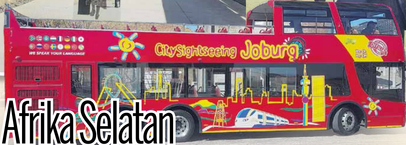
PENGUNJUNG boleh menaiki bas persiaran Hop On Hop Off ketika mengelilingi Johannesburg.