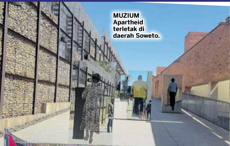
MUZIUM Apartheid terletak di daerah Soweto.