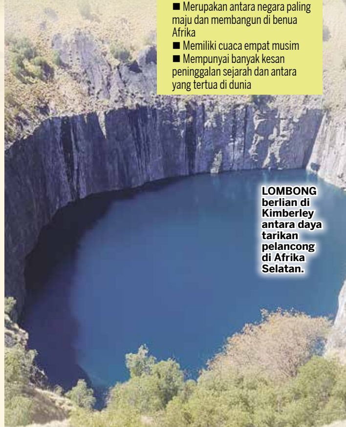
LOMBONG berlian di Kimberley antara daya tarikan pelancong di Afrika Selatan.

Tidak ketinggalan, adalah persiaran bot mengelilingi perairan dermaga V&A yang memberi peluang kepada pengunjung menyaksikan anjing laut yang bermain sepanjang hari.